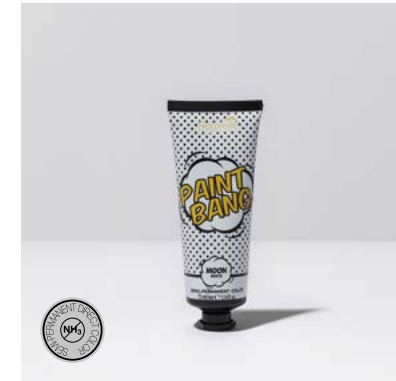
PAINT BANG MOON SHADE 75 ml

FR. ACTIVATOR: Crème oxydante stabilisée à bas volume spécialement formulée pour la coloration Nouvelle Touch afin d'obtenir des reflets naturels et brillants. ACTIVATOR SPECIAL RED: Crème oxydante spécialement formulée avec la coloration Nouvelle Touch pour obtenir des reflets vibrants et brillants.