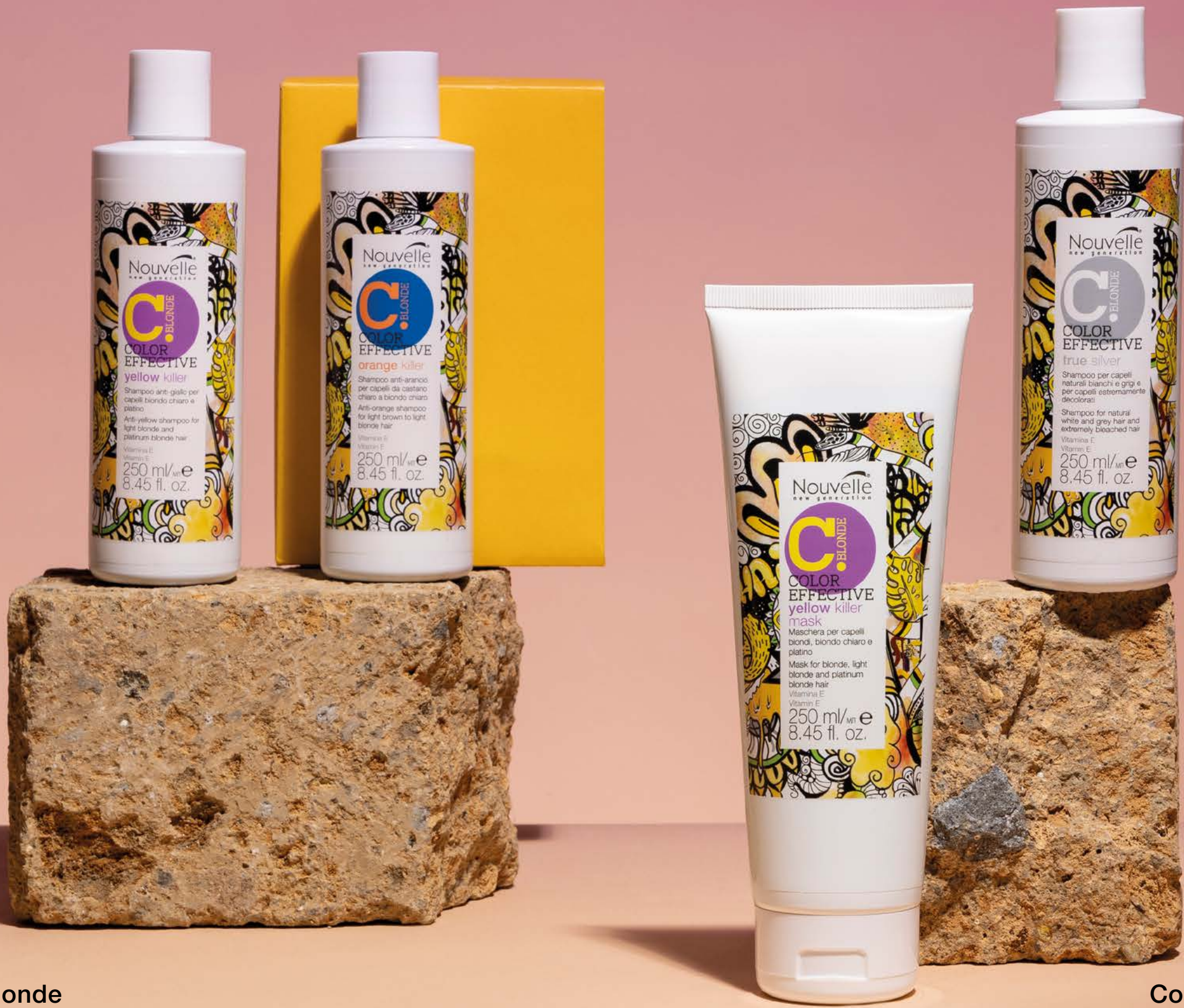
Color effective blonde