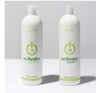
ACTIVATOR & ACTIVATOR SPECIAL RED 7 / 13 VOL 1000 ml

FR. Crème colorante ton sur ton sans ammoniacque, pour des reflets durables, naturels et accentués. 40 nuances disponibles.