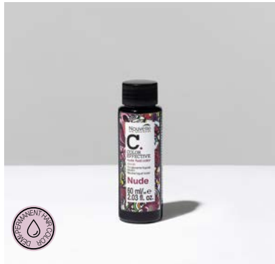
NUDE FLUID COLOR SHADE 60 ml

Demi-permanent liquid neutral toning dye.