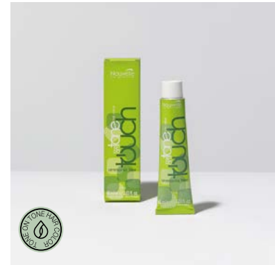
NOUVELLE TOUCH 1:1,5 60 ml

FR. Coloration tonalisante liquide demi-permanente utilisable comme illuminant avec l'activateur spécifique. Elle peut être aussi mélangée avec toutes les autres nuances de tonalisant liquide pour atténuer l'intensité de la couleur.