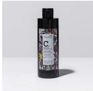
CLEAR FLUID COLOR BOOSTER 400 ml

FR. Coloration tonalisante liquide demi-permanente neutre.