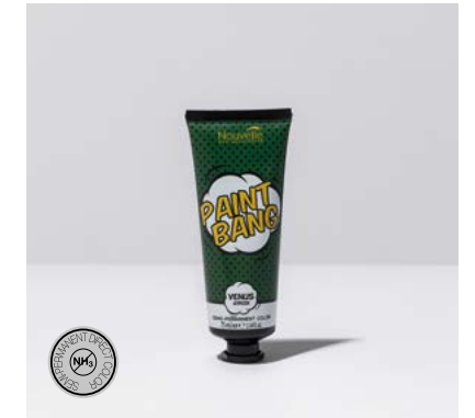
PAINT BANG COLORS 12 COLORS 75 ml

FR. Mélanger Moon Neutral avec les autres couleurs Paint Bang pour créer une infinie variété de tons pastel.